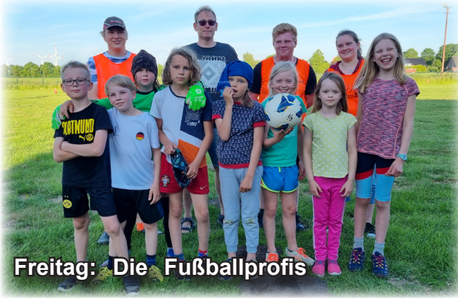
Freitag: Die Fußballprofis